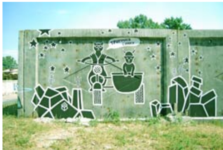
Джим Мощенко / ул. Кацарская 52