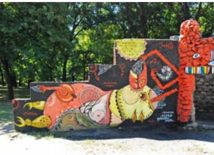
Сергей / парк Юность