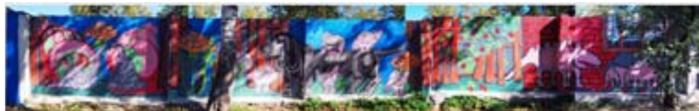
Таня Саенко / парк Маяковского