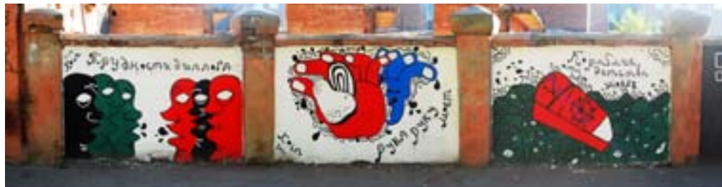
Денис Коин / ул. Красноармейская 20