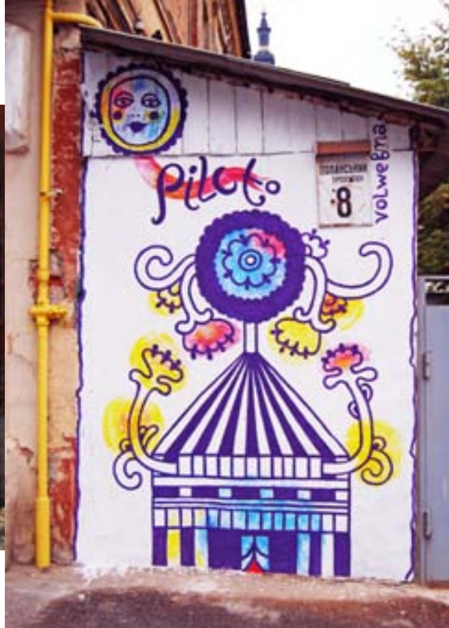
Юлиана Алимова / пер. Лопанский 8