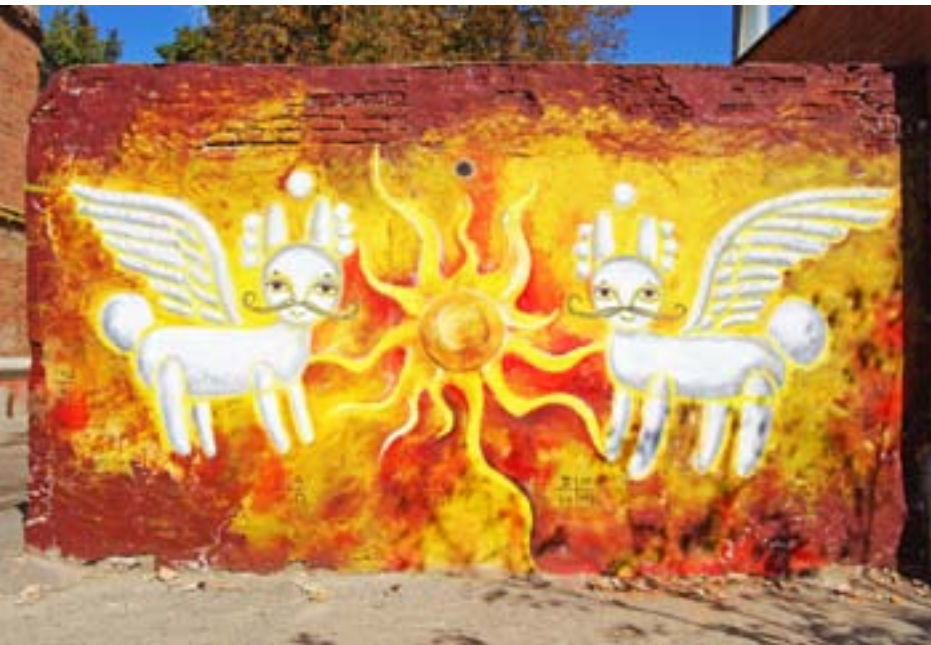
Джим Мощенко / ул. Кацарская 52