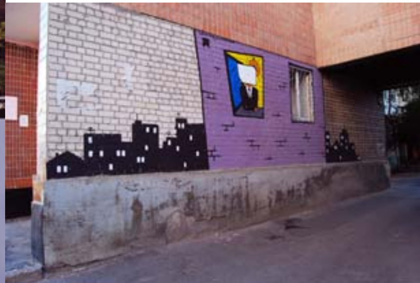
Рома Минин / пер. Лопанский 9