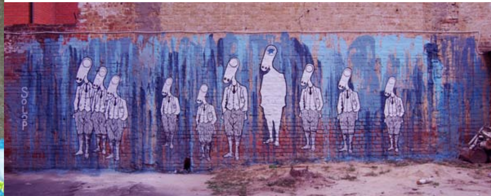
Оксана Солоп / ул. Красноармейская 10