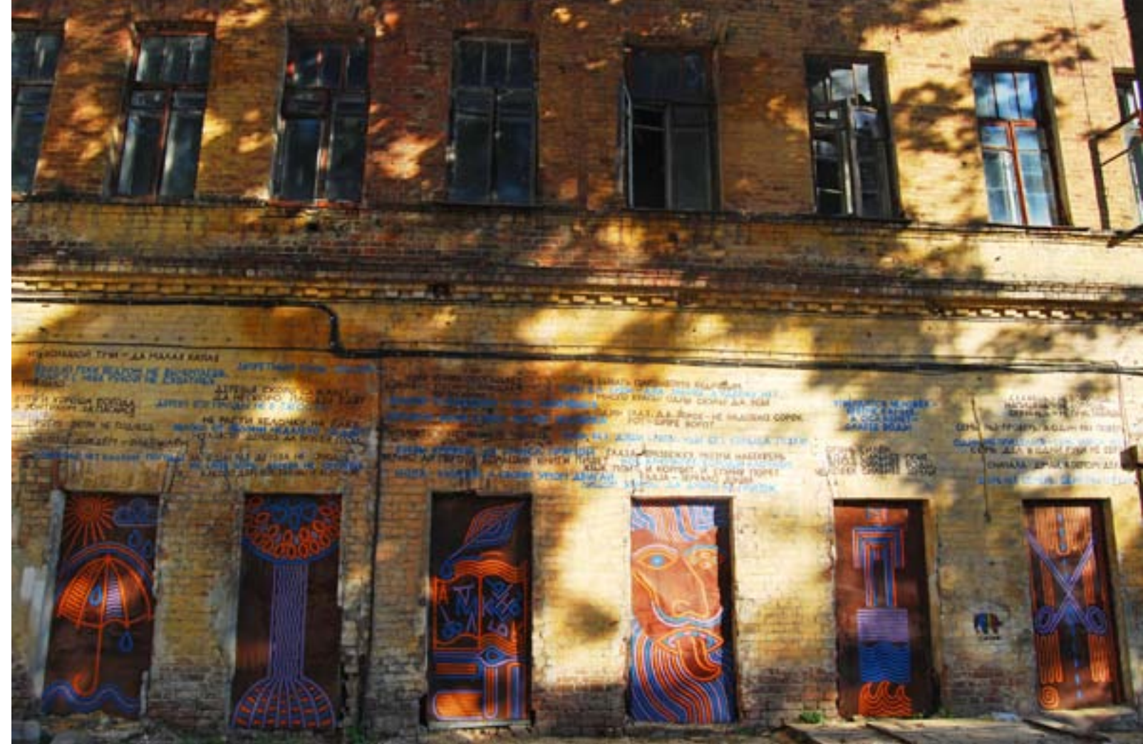
Евгений Петраков / Лопанская Набережная 1