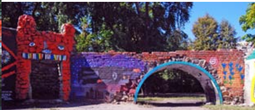
Марьяна Тариш / парк Юность