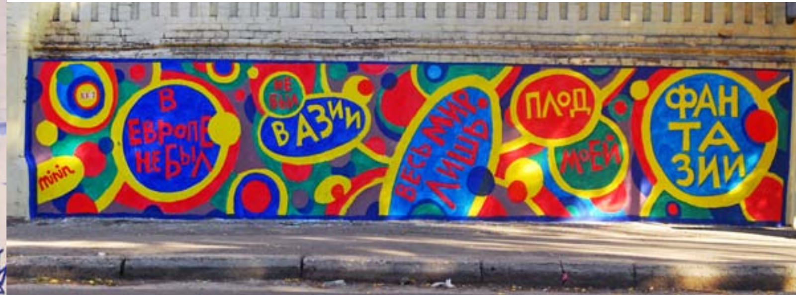
Рома Минин / пер. Лопанский 8