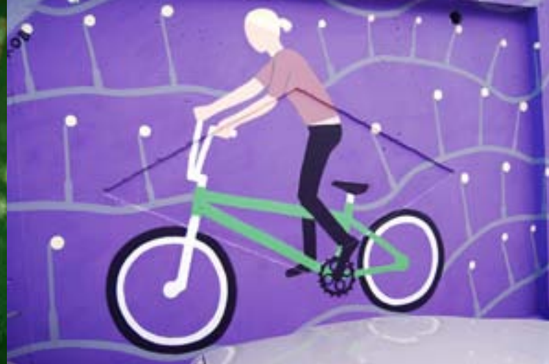
Миша Грудий / ул. Славянская