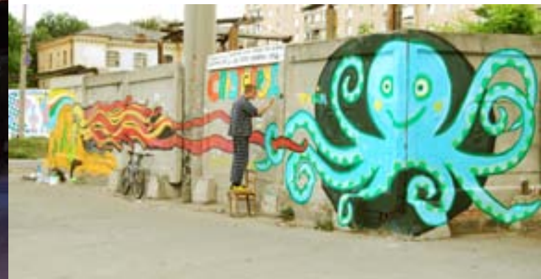
Рома Минин / ул. Славянская 1